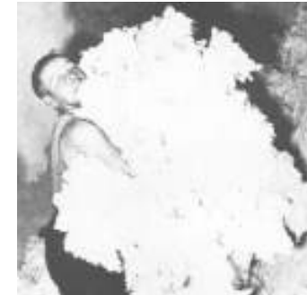
Spinnereiarbeiter in den 50er Jahren