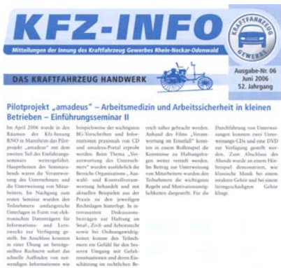
Abb. 5.2: Beispiel Pressemitteilung

Öffentlichkeitsarbeit in jeder Form ist unabdingbar für eine breite, publikumswirksame Verankerung und Information aller Beteiligten.