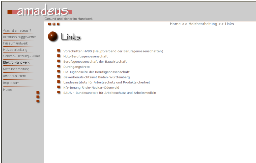
Abb. 15.6: Weiterführende Links

Hier sind die Internet-Adressen der wichtigsten Unfallversicherungsträger, Gewerbeaufsicht, Durchgangsarzte, Innungen, Kammern, BAuA, etc. angeführt.