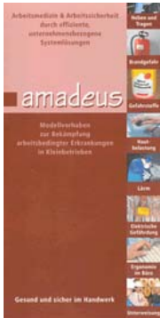
Abb. 5.1: Der amadeus-Flyer

Flyer stellen in einer sehr kurzen, prägnanten Form ein Projekt vor und sind ein gutes Werbemittel. Sie sind Teil der Öffentlichkeitsarbeit und können breit gestreut werden, z.B. in Foyers und Besprechungsräume aller beteiligten Organisationen. Eine weitere Streuung sollte im Rahmen von Veranstaltungen erfolgen.